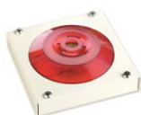
МАЯК-220-КПМ1-НИ оповещатель комбинированный, металлический корпус, наружное исполнение