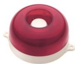
МАЯК-12-КП, МАЯК-24-КП оповещатель комбинированный